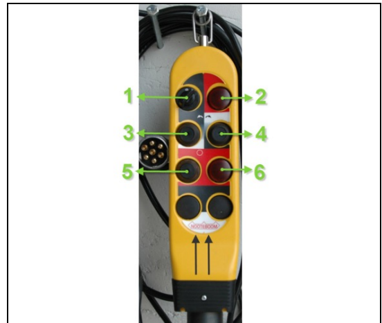
Abbildung Error! No text of specified style in document. -1:Steuertafel Handsteuerung

Siehe Abbildung Error! No text of specified style in document. -2: Funkgesteuertes Handgerät