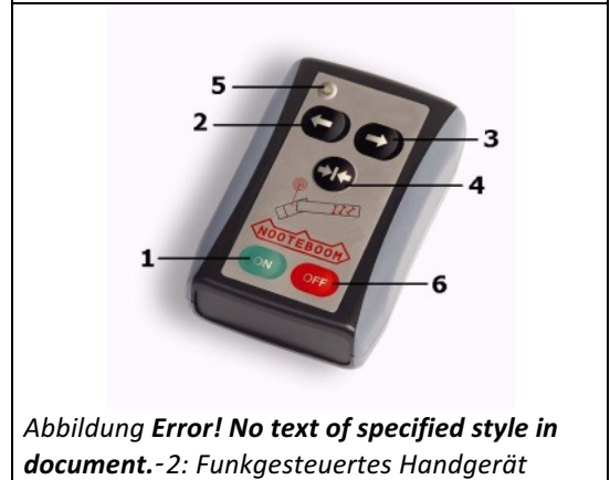
Abbildung Error! No text of specified style in document. -2: Funkgesteuertes Handgerät